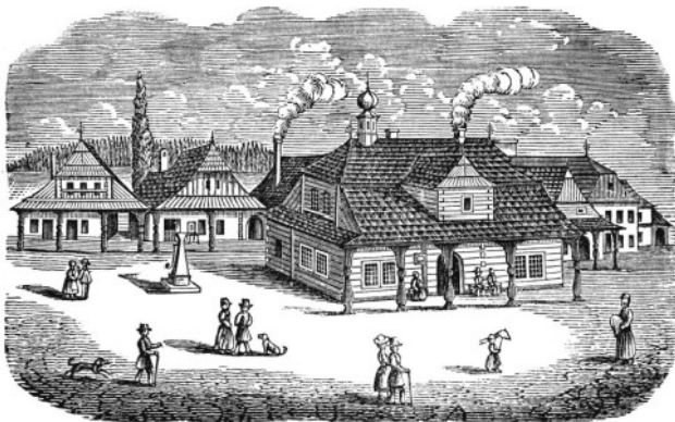
Rys.3. Rynek z ratuszem, 1855 rok.