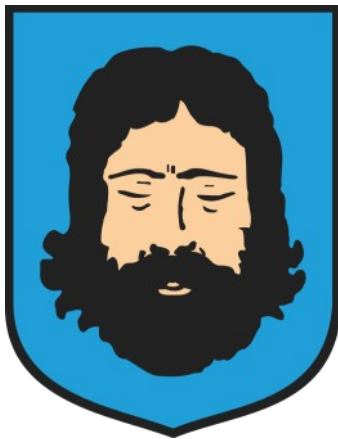
Rys.1. Herb miasta Mysłowice.

Mysłowice leżały na ważnym szlaku handlowym pomiędzy Wrocławiem, a Krakowem. Tędy od wieków wiodła droga pomiędzy Bytomiem, a Pszczyną. Do końca XVIII w. Mysłowice były miasteczkiem głównie o charakterze rolniczym. Od tego czasu na myśłowickich terenach zaczęło rozwijać się górnictwo oraz hutnictwo cynku . Wydobywano węgiel kamienny oraz rudę żelaza. Pierwsze kopalnie węgla powstawały tutaj już pod koniec XVIII w., a pierwsza huta cynku na Górnym Śląsku powstała w 1798 roku w Wesołej (dzisiejsza dzielnica Mysłowic). Na przełomie XIX i XX wieku Górny Śląsk z Mysłowicami stał się znaczącą w całej Europie aglomeracją przemysłową ( Fot.1 ).