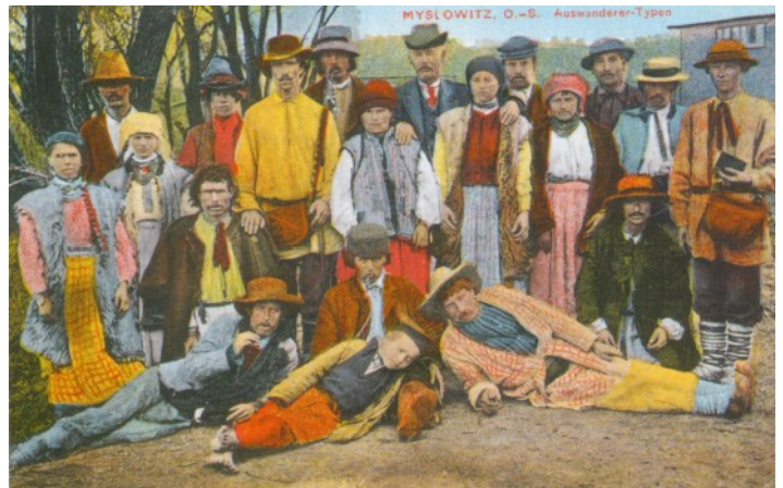
Fot.14. Emigranci, początek XX w.