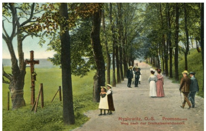
Fot.16. Promenada, początek XX w.