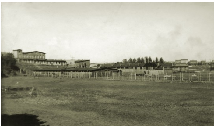
Fot.15. Tereny więzienia i obozu pracy.